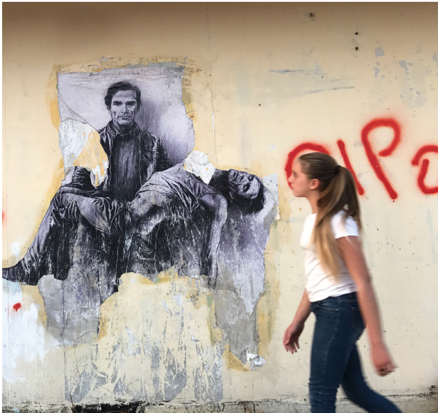
Collage de Pasolini par Ernest Pignon-Ernest sur les murs de Scampia, banlieue de Naples.