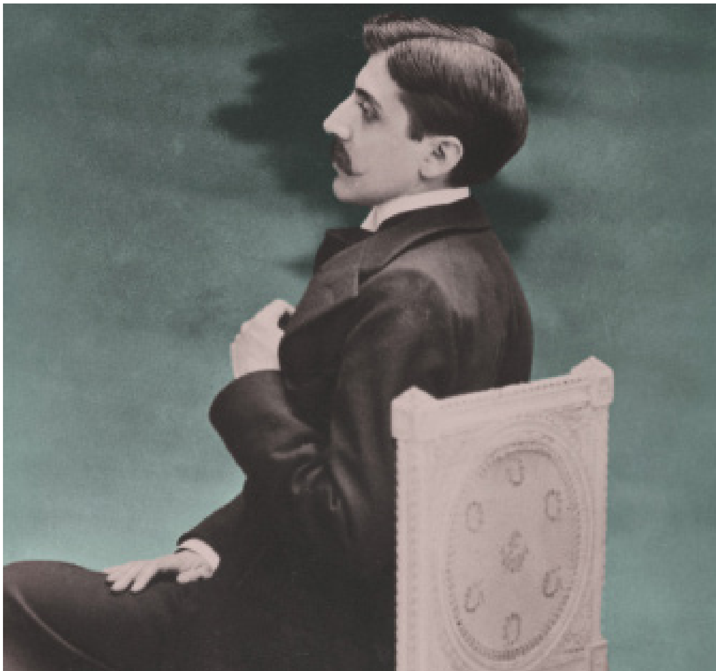
Marcel Proust par Otto Wegener, dit Otto, 1896, Maison de Tante-Léonie - Musée Marcel-Proust