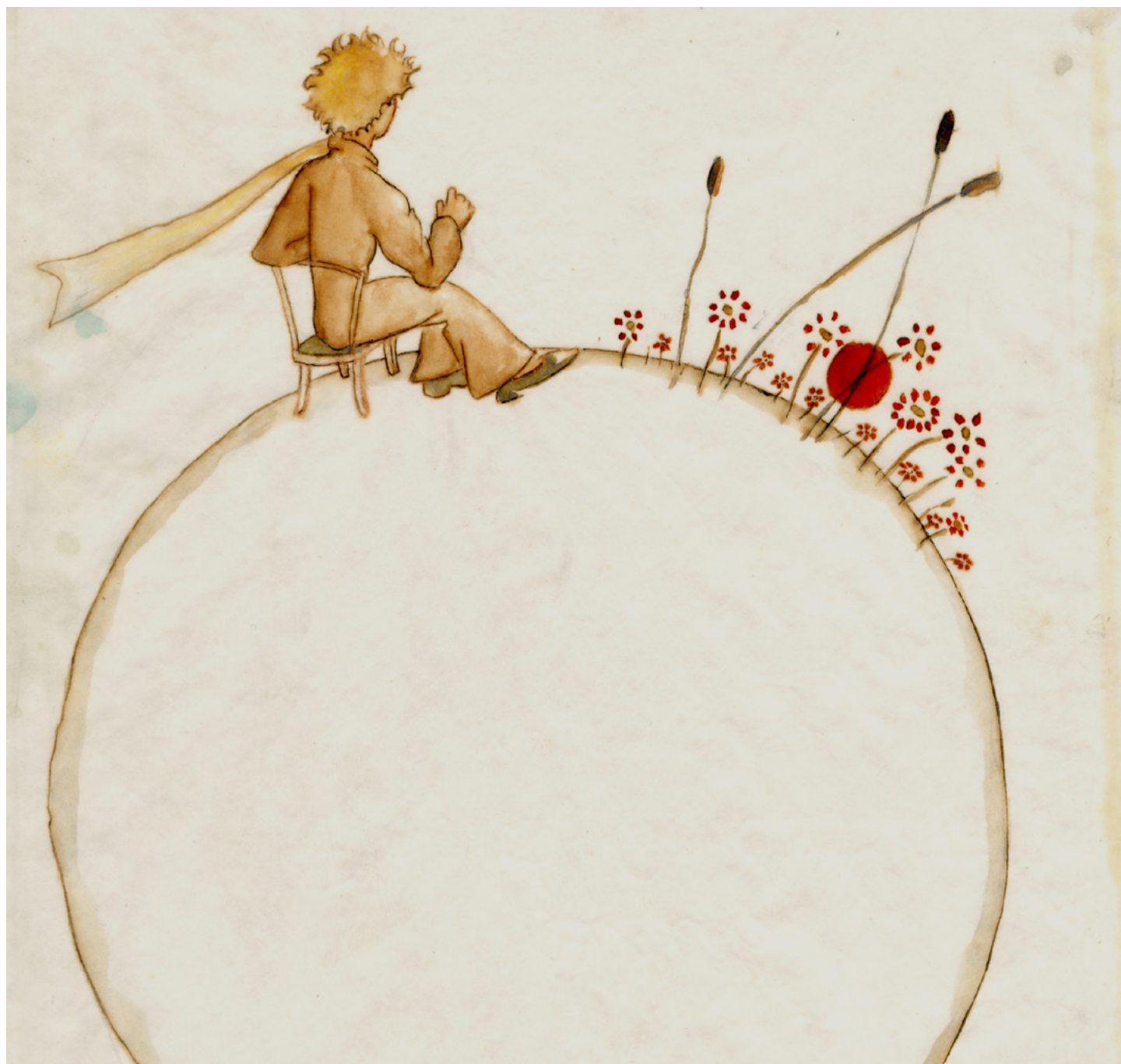
Dessin original d'Antoine de Saint-Exupéry pour Le Petit Prince, collection particulière