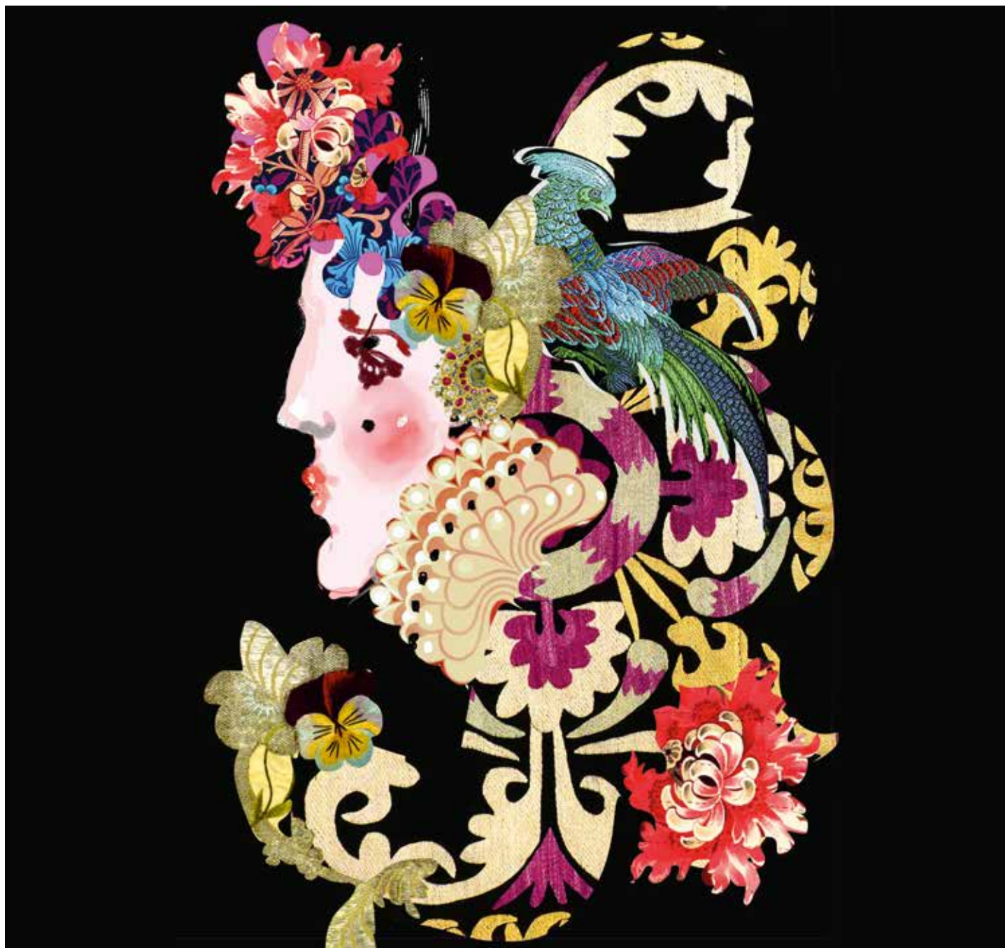
Palette graphique, collage - 42 x 60cm © Monsieur Christian Lacroix, 2018.